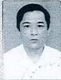
Chân lý của người được cấp chứng chỉ